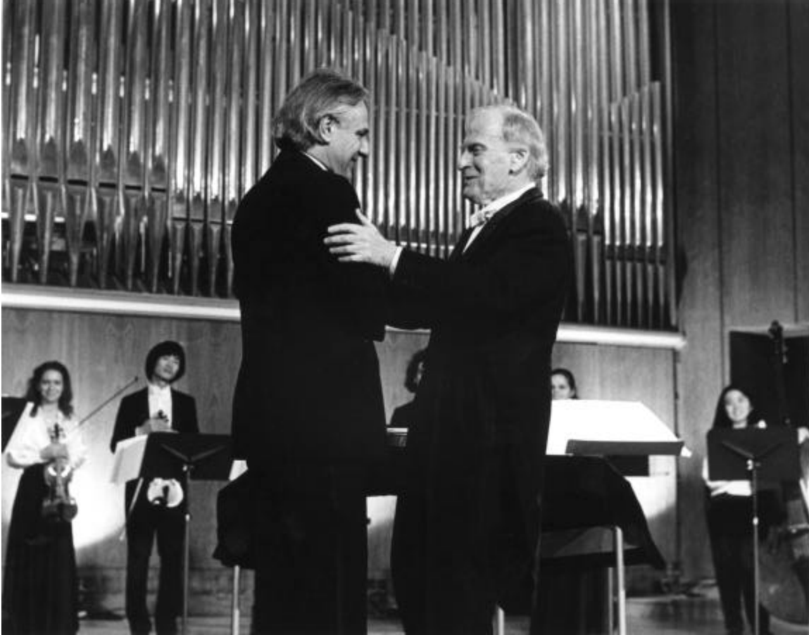
André Prévost et sir Yehudi Menuhin lors de la première de la Cantate pour cordes, 1987.